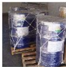
符合易燃液体标准的药品