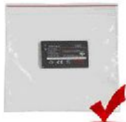
电池放入塑料袋中