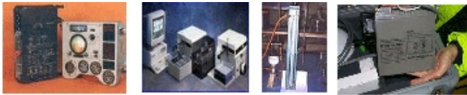
○ 气压计 仪器中的电池