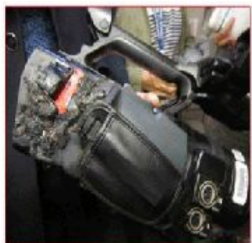
摄像机在客舱着火