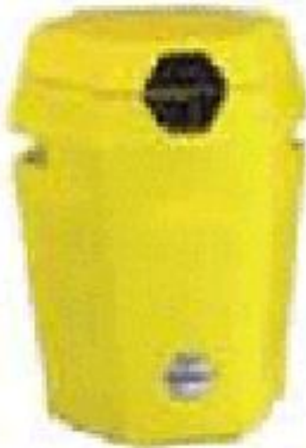
非限制性的液氮绝热包装