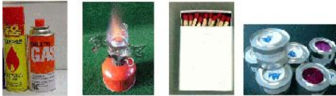
○ 丁烷气体 野营炉 火柴 固体酒精