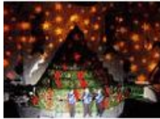
电影及舞台特殊效果设备