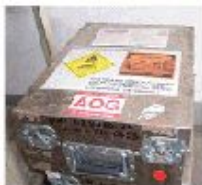
紧急航材-化学 氧气发生器