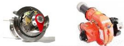
汽车燃油控制装置