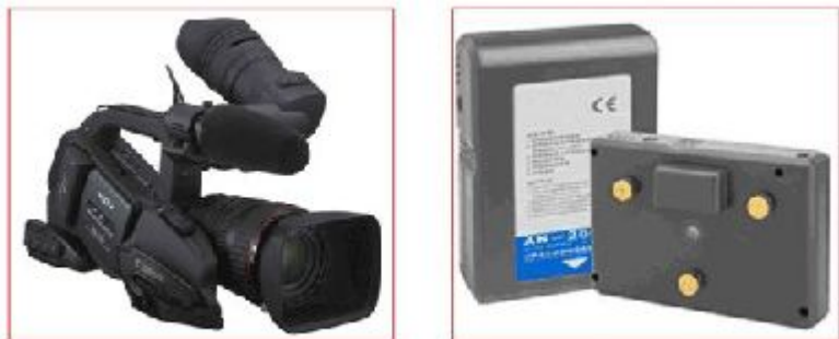
超过100Wh的大电池图例

more than two spare batteries can be carried by per passenger.Do not check in luggage