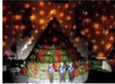
电影及舞台特殊效果设备