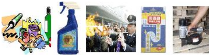
○ 油漆 上光剂 气溶胶 下水道清洁剂 射钉枪