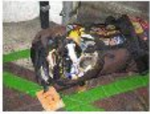
旅客背包内之 打火机起火