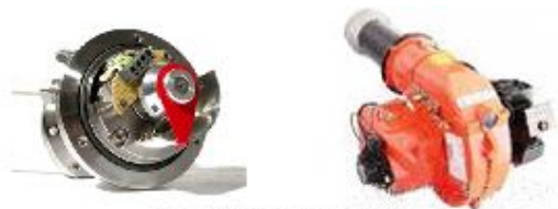
汽车燃油控制装置