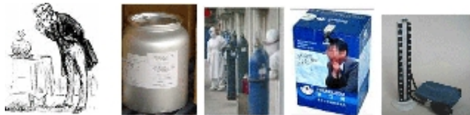
医药中间体 医用氧气 氧气发生器 血压计